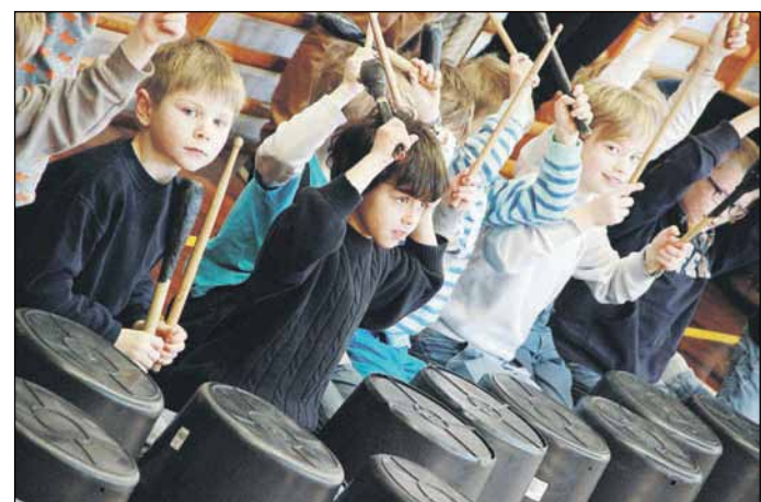
Stomp var et tilløbsstykke.