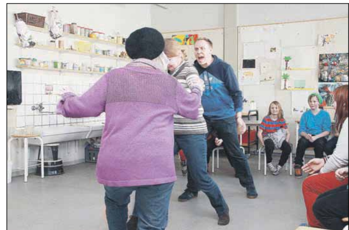
Lærerne spillede nogle scener, hvor de viste konflikter...