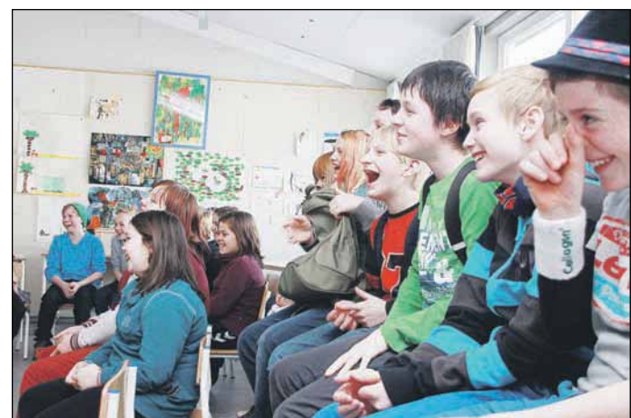
...Det syntes eleverne var mægtig skægt