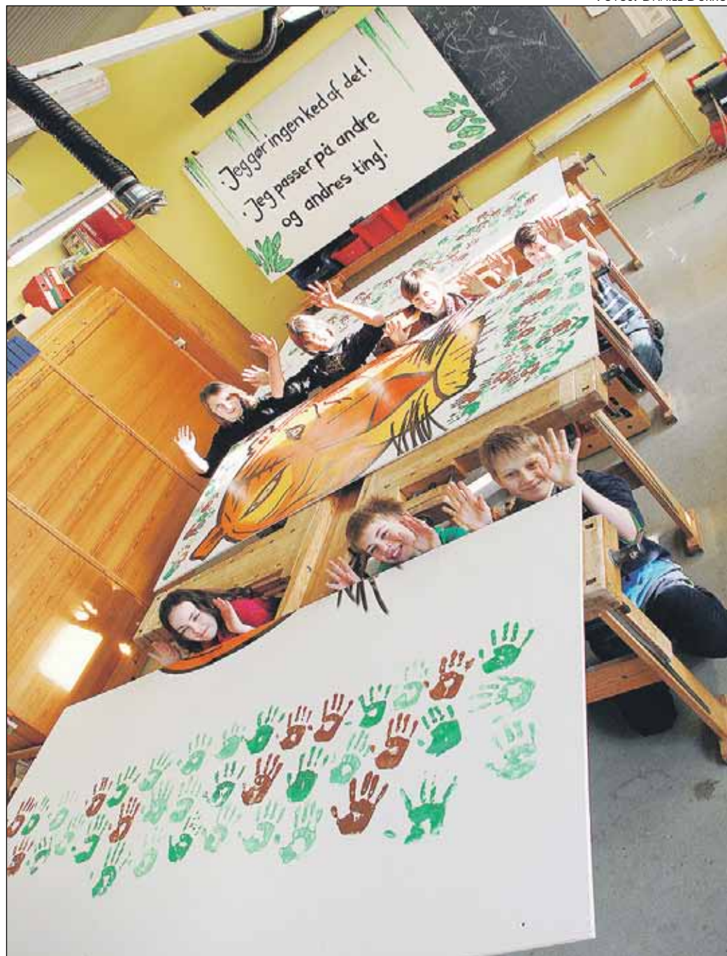
Eleverne gav et håndtryk på, at de vil være gode kammerater.

- Vi har på tigerdagen haft forskellige workshops. Der har både været kreative workshops, hvor børnene blandt andet har malet skolens nye logo, en tiger, de har også øvet skolens sang