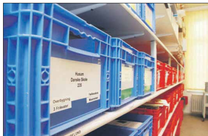
Kørselsordningen er en af Skoleforeningens livsnerver.

På trods af de mange arbejdsopgaver er der en rigtig god stemning på indkøbskontoret.