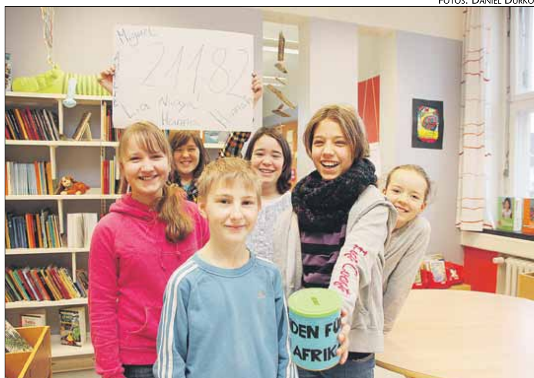
220 euro blev det til ved gadeindsamlingen.

- Uanset hvilket beløb, der kommer ind til Danmarks Indsamling, går pengene til projekter, som vi ellers ikke ville have mulighed for at