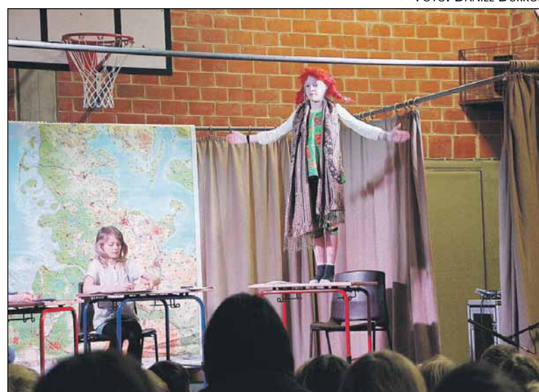
Skolens elever opførte Pippi Langstrømpe.