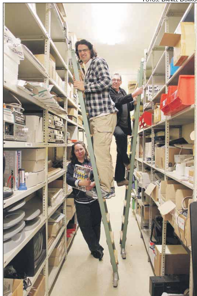
Indkøbskontoret huser et utal af forskellige opgaver. Fra genbrug af batterier og patroner til indkøb af legeredskaber.