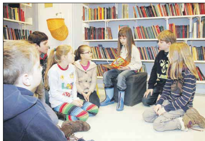
En god gerning: Læs for dine kammerater

starte. F.eks kan vi nu ruste tusindvis af mennesker i Uganda mod naturkatastrofer. Vi kan hjælpe nogle af de mange børn, der lever af under- eller fejlernæring i Burkina Faso, styrke demokratiske rettigheder, sikre uddannelse og adgang til lægehjælp. 12 projekter som vil betyde alverden, dér hvor behovet er størst, siger talsmand for Danmarks Indsamling, Line Grove Hermansen.