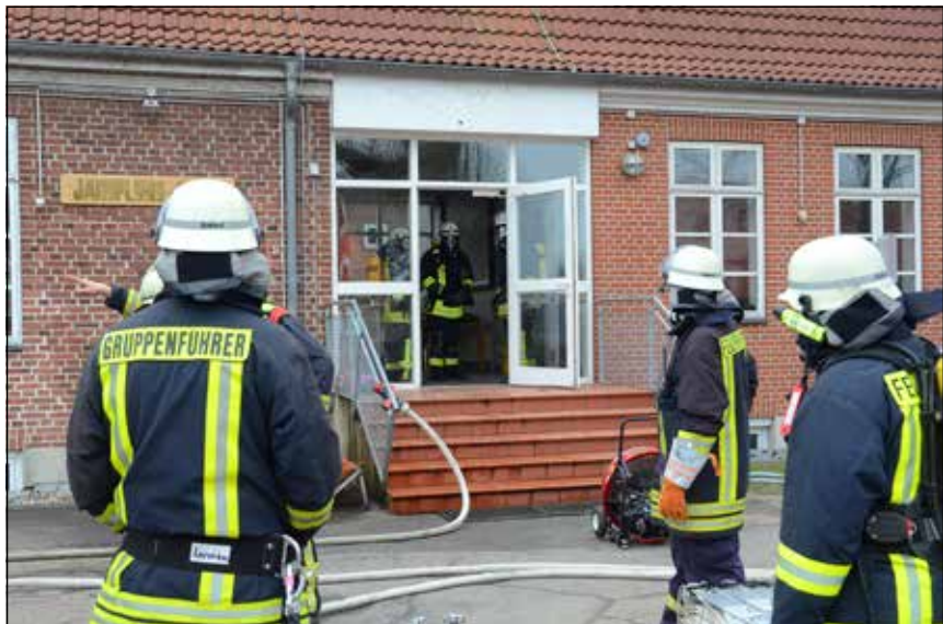
Brandvæsenet måtte rykke ned i kælderen for at slukke branden.