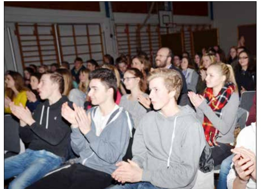
Nogle af eleverne havde forventet covernumre, men overgav sig hurtigt til bandets musik.