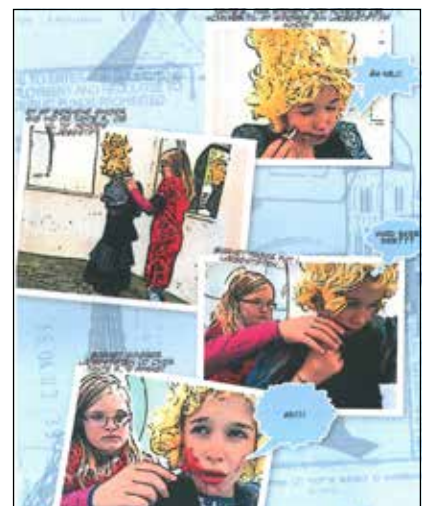
Eleverne laver drejebog ud fra skitser.

de forskellige workshops. Derfor er det vigtigt, at vi ud fra ansøgningerne kan se, at eleverne brænder for at deltage i netop denne workshop, siger Gabriele Fischer-Kosmol fra Center for Undervisningsmidler.