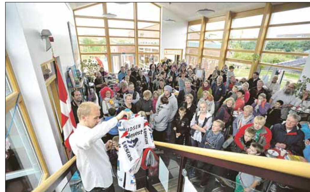
Den nye danske skole i Hanved.

- For os som mindretalsparti er det vigtigt, hvordan vi sælger