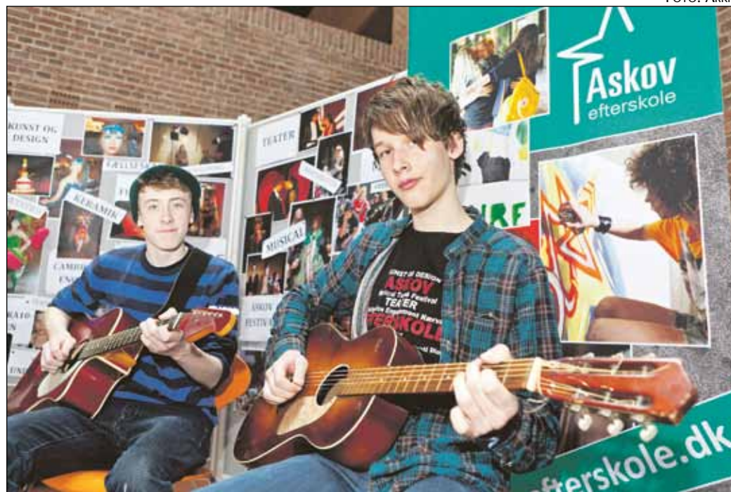
Når der er efterskolernes dag på Duborg Skolen kan eleverne informere sig om tilbud fra efterskolerne i Danmark.