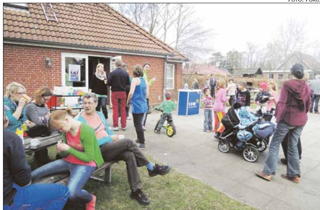
Mindretallet i Vanderup samles til hygge på skolen.

Noget helt særligt ved netop denne aktivitetseftermiddag var, at de havde et stort ryk- ind af lokale SSW-listekandi- dater, som forkælede alle