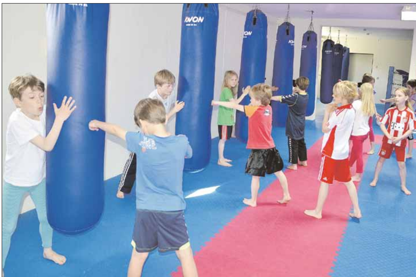
Eleverne fik sved på panden, da de var til boksetræning.

- På denne måde pakkes følelserne ind i at være den fiktive persons følelser, hvilket tit åbner for ærligheden hos den enkelte. Oplevelserne