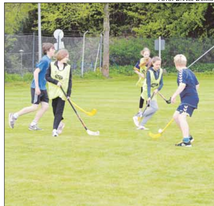
Gustav Johannsen-Skolen og Duborg-Skolen i et hockey-opgør.