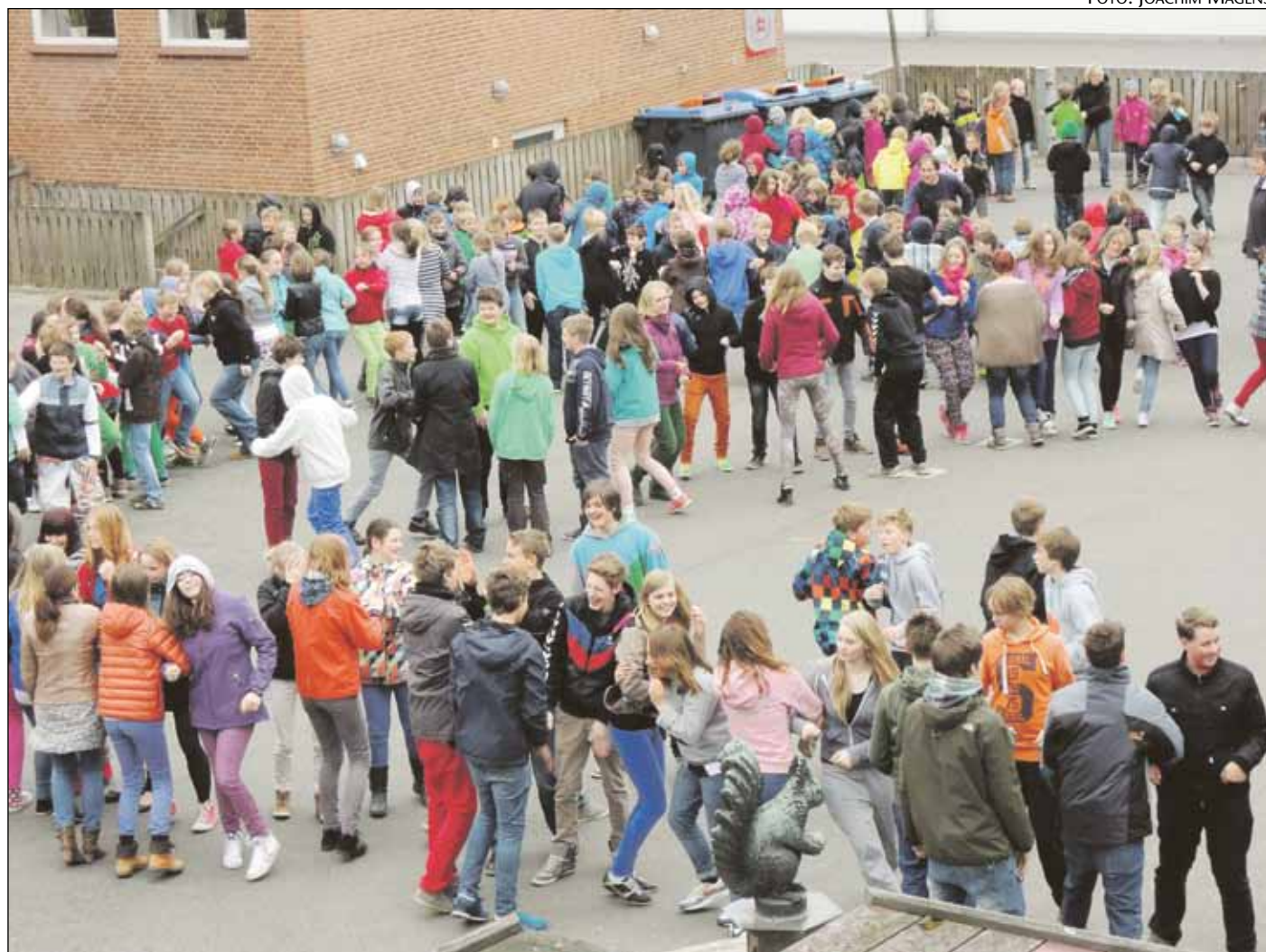
Dansens Dag blev i Egerntørde rykket ud i skolegården.