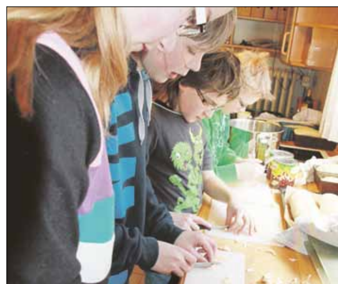
Eleverne lavede også mad fra Nicaragua.

- Eleverne har arbejdet rigtig hårdt for det her, og det kan man se, siger hun.